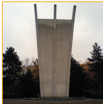
„Hungerharke“ in Tempelhof

Juni 1948 bis Mai 1949 kamen alle Güter von Brennstoffen, Lebensmitteln, Medikamenten bis hin zu schweren Maschinen aus der Luft. Die Luftbrücke war der Startpunkt für den Berliner Flughafen Tegel, der eilig mit eingeflogenen Maschinen in seinen Ursprüngen mitten in der Jungfernheide (also im französischen Sektor) angelegt wurde. Die britische Royal Air Force flog gar mit Wasserflugzeugen und landete auf der Havel vor der Spandauer Küste; natürlich in „ihrem“ Sektor. Im amerikanischen Sektor lag der Flughafen Tempelhof. Unvergessen sind Helden wie der Pilot Jack Bennett, der als erster in Berlin landete. Mit einer Maschine voll Kartoffeln! Insgesamt 2,34 Millionen Tonnen Fracht wurden in die Stadt geflogen bis die Sowjets kläglich das Scheitern ihrer Pläne einsehen mussten und die Zufahrtswege zur Stadt auch auf dem Land- und Seewege wieder freigaben. Bei den 278.000 Flügen gab es leider auch Unfälle: