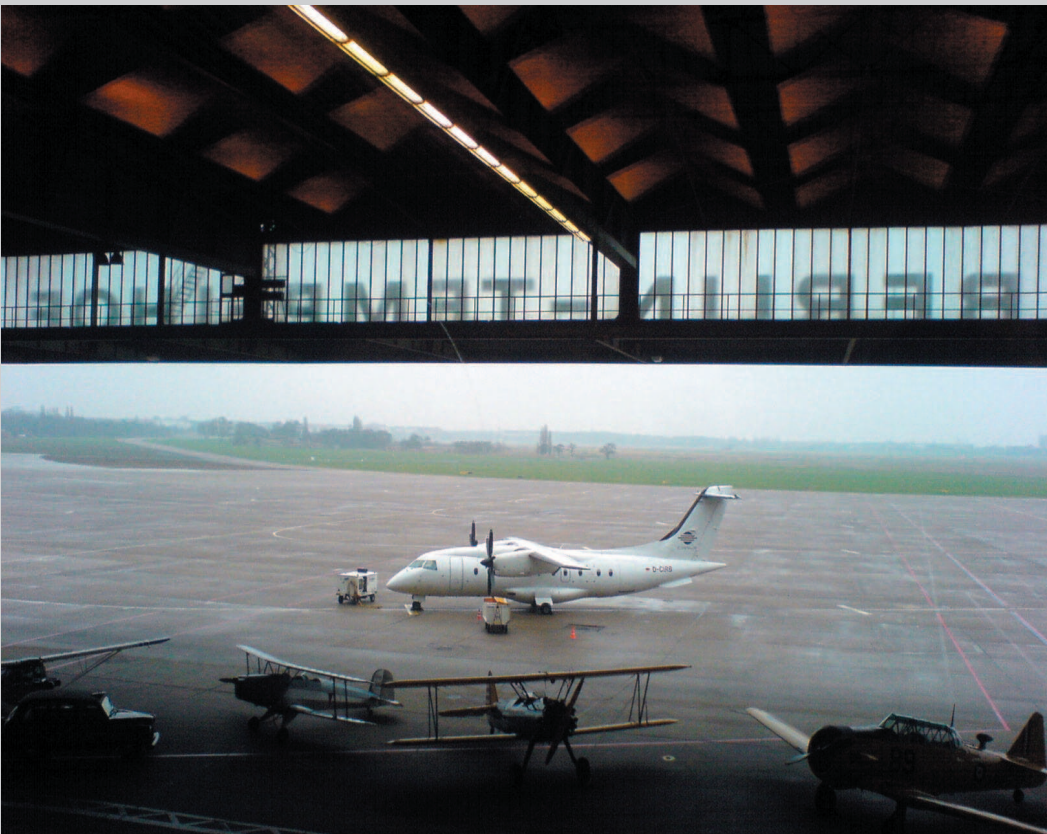
Flughafen Tempelhof - Tradition, Zukunft, Arbeitsplätze, Kaufkraft